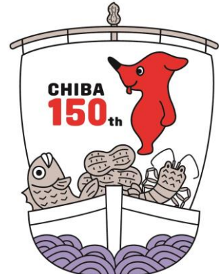
「千葉県 PR マスコットキャラクター チーバくん」

千葉県の誇る伝統郷土料理「太巻き祭りずし」は、切り口の文様の美しさに加え、地域の食材を生かすことができ、作る楽しみ、食べる楽しみがあります。当研究会ではこのすばらしい技術を絶やさぬように努めておりその活動の一環として、今年度は小学生・中学生を対象にデザインのアイデア募集を実施します。食べてみたいな～と思う、すてきな太巻きずしのデザイン画が届くことをお待ちしております。